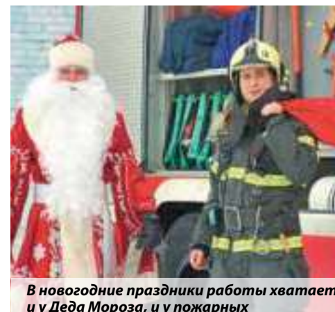
В новогодние праздники работы хватает и у Деда Мороза, и у пожарных