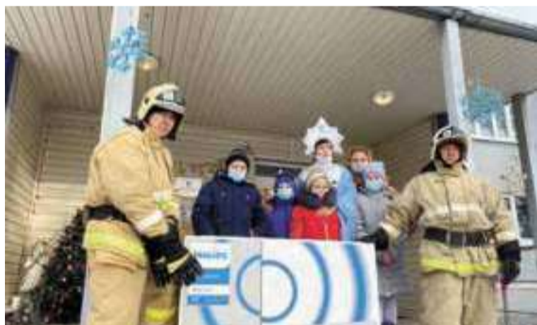
Воспитанники курской школы-интерната для детей с ограниченными возможностями здоровья № 5 получили в подарок от местных огнеборцев сладости и огромный телевизор