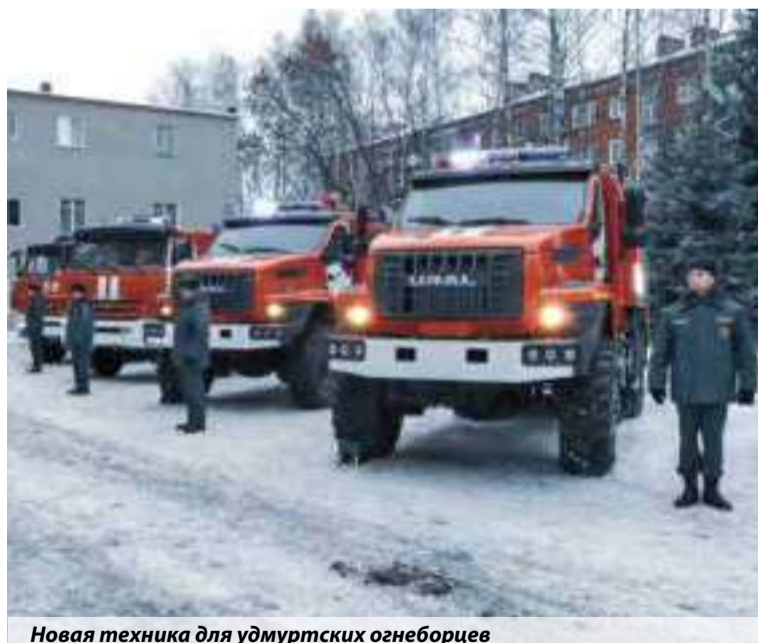
Новая техника для удмуртских огнеборцев

— Обстановка на территории республики в этом году была сложная. Но благодаря слаженным действиям органов государственной власти, местного самоуправления и организаций все ситуации были разрешены вовремя и оперативно. Хочу отметить деятельность руководства Главного управления МЧС России по Удмуртской Республике, которое принимает все меры для повышения уровня материально-технического обеспечения подразделений, что позволяет эффективно бороться с возникающими ЧС