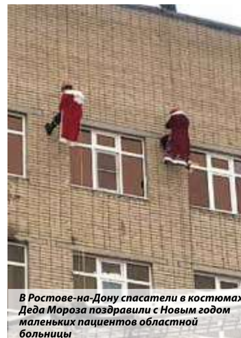
В Ростове-на-Дону спасатели в костюмах Деда Мороза поздравили с Новым годом маленьких пациентов областной больницы