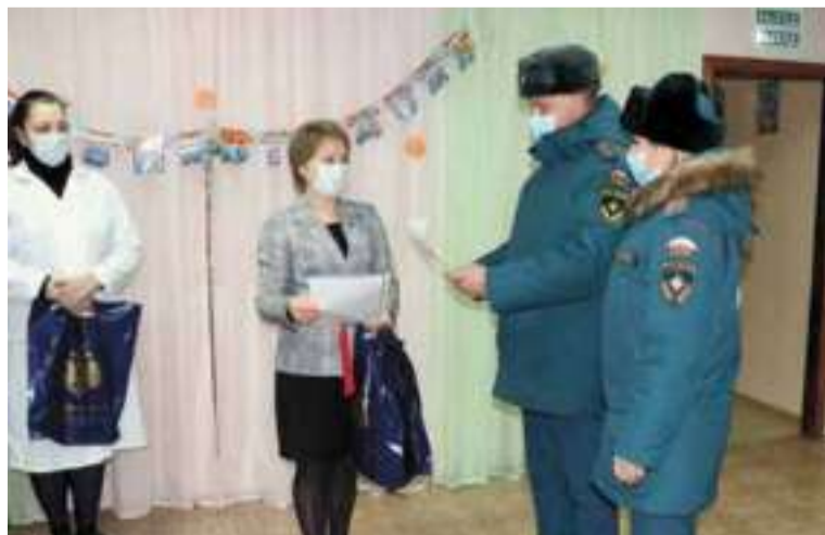
В преддверии Нового года сотрудники ГУ МЧС России по Брянской области поздравили воспитанников Центра социальной помощи семье и детям поселка Белые Берега Фокинского района